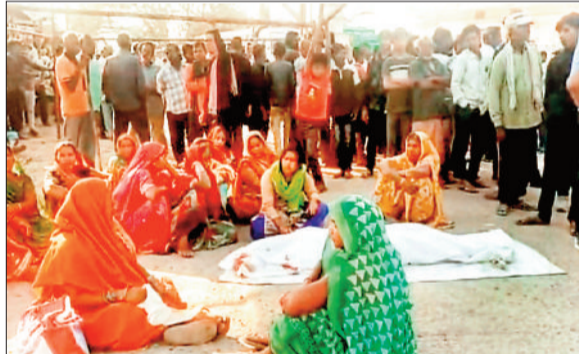
सड़क पर शव रखकर विलाप करते परिजन।

देधियों पर कार्रवाई की मांग की है। बीती रात सम्मेलन सिदार ने अस्पताल के दो अन्य कर्मचारियों के साथ शराब का सेवन किया था। बताया जा रहा है कि अस्पताल के सीसीटीवी फुटेज की जांच से इस संबंध में और तथ्य सामने आ सकते हैं। फिलहाल मामले को लेकर जांच की मांग तेज हो गई है।