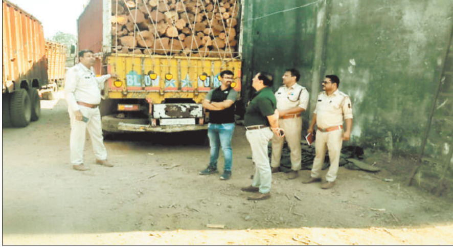
मौके पर कार्रवाई करते वन विभाग की टीम।

गौरतलब है कि नवागढ़ ब्लाक अंतर्गत ग्राम पंचायत भादा में बंद पड़े राईस मिल परिसर में अवैध रूप से लकड़ी की तस्करी करके उसे वहां रखने का मामला सामने आया है। इस बात की सूचना जब वन विभाग की टीम को मिली तो इसे लेकर संयुक्त टीम बनाकर मंगलवार 17 फरवरी को टीम ने ग्राम भादा के राईस मिल में दबिश दी। रायगढ़ से लेकर यहां डंप किए गए खैर एवं तेंदू के अवैध रूप से रखे करीब 15 ट्रक लकड़ी को जब्त करने की कार्यवाही की गई है। जब्त लकड़ी की कीमत करीब 50 लाख रूपए बताई जा रही है। इस कार्यवाही से लकड़ी के अवैध कारोबार में लगे माफियाओं में हड़कंप मच गया है। बताया जा रहा है कि ग्राम भादा में जिस राईस मिल का संचालन किया जा रहा था। वह अब पूरी तरह से बंद हो चुका है। वहीं कुछ लोगों के द्वारा इसे किराए पर लेकर इस तरह का कारोबार कर रहे थे। बताया जा रहा है कि रायगढ़ जिले से कीमत लकड़ी तेंदू एवं खैर को लाकर उसे मशीनों