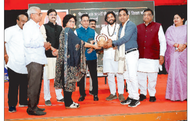
मखंभ को राष्ट्रीय स्तर पर पहचान दिलाने वाले पुष्कर दिनकर को सम्मानित करते अतिथिगण।