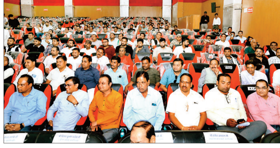
कार्यक्रम में उपस्थित नगर के गणमान्य नागरिक।